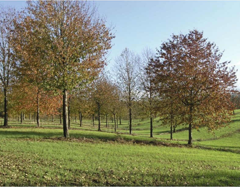
Figure 1 | Merisiers destinés à la production de bois d'œuvre en France.